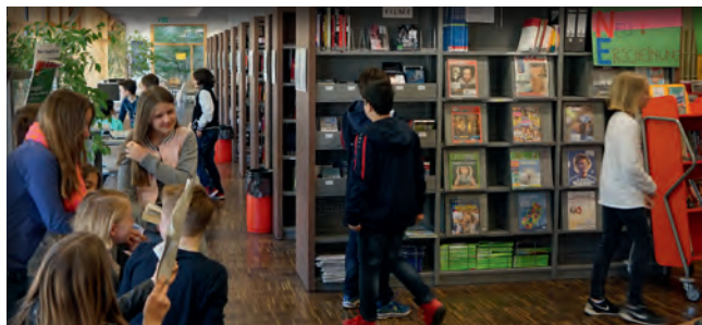
Das Schmuckstück unserer Schule, die Bibliothek, braucht ‚Zuwachs‘. Wir kümmern uns darum.

Kinder haben oft, im wahrsten Sinne des Wortes, viel zu tragen. Wir finanzieren und verwalten Spinde , um ihnen einen Teil der täglichen Last abzunehmen. Sie erwarten eine vernünftige Grundausstattung mit PCs , um Unterricht und Schulbetrieb auch in Zukunft zu sichern? Wir unterstützen die Schillerschule bei Anschaffung und Wartung.