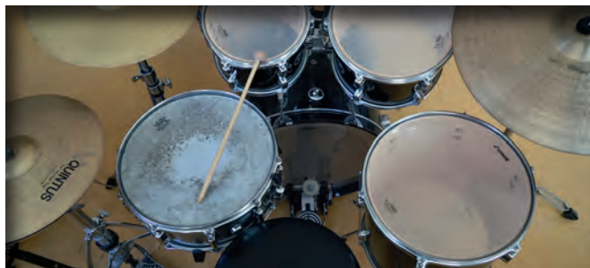
Die musikalische Bildung liegt uns am Herzen.

Deshalb wurde der Förderverein ins Leben gerufen. Er unterstützt Schule, Schulleitung, Lehrer und unsere Kinder in allen Aktivitäten, die ein aktives, humanistisches und facettenreiches Schulleben möglich machen.