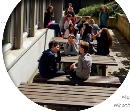
Mensa draußen? Wir schaffen das!