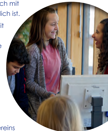
Technische Ausstattung zu warten ist wichtig. Wir möchten dies sicherstellen können. Mit Ihrer Unterstützung gelingt es.

Als Mitglied unseres Fördervereins helfen Sie, schon mit einem kleinen Jahresbeitrag, die Zukunft der Schillerschule als umfassende und attraktive Bildungseinrichtung für unsere Kinder zu erhalten.